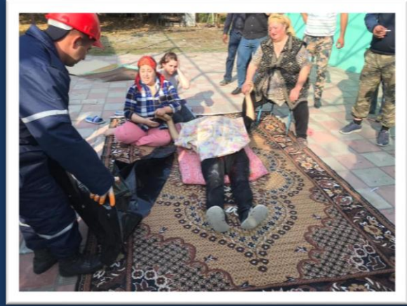
Ermənistan Silahlı Qüvvələrinin Bərdə şəhərinə qarşı törətdiyi hücumun nəticələri

Azərbaycan, Rusiya Federasiyası və Ermənistan liderləri tərəfindən 10 noyabr tarixində Üçtərəfli Bəyanatın imzalanması ilə hərbi fəaliyyətlər başa çatmışdır. Bəyanat otuz ilə yaxın Ermənistan və Azərbaycan arasında davam etmiş silahlı münaqişəyə son qoymuş və Ermənistan silahlı qüvvələrinin Azərbaycanın qalan işğal olunmuş ərazilərindən çıxarılması, məcburi köçkün əhalinin öz yurdlarına qayıtması və o cümlədən Azərbaycanın qərb bölgələri ilə Azərbaycan Respublikasının Naxçıvan Muxtar Respublikası arasında bağlantıların yenidən yaradılması vasitəsilə bütün nəqliyyat kommunikasiyaların bərpa edilməsi kimi sülh, təhlükəsizlik və sabitliyin yaradılmasına yönəlmiş tədbirlərin həyata keçirilməsini nəzərdə tutmuşdur.