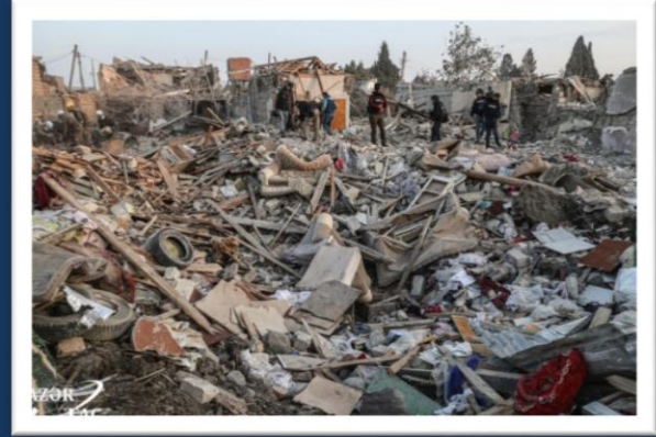
Raket hücumlarından sonra Gəncə şəhəri (17 Oktyabr 2020)