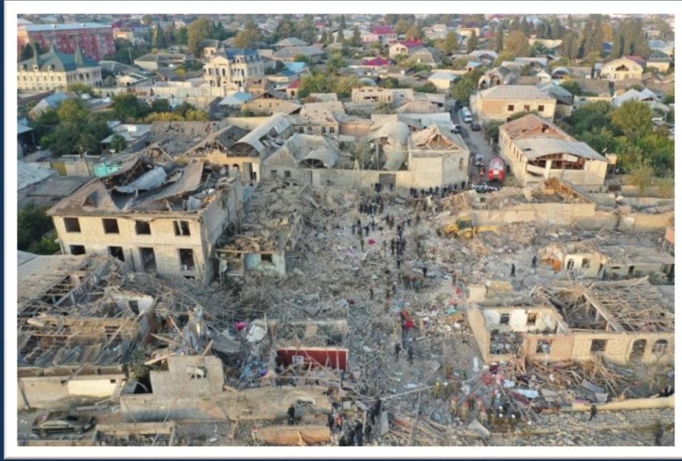
Gəncədə dağıdılmış yaşayış evləri